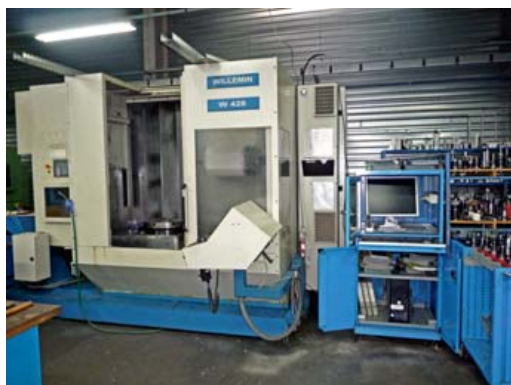
Centre d'usinage WILLEMIN W428,+- 5 axes