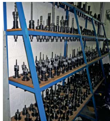
Outils de découpe