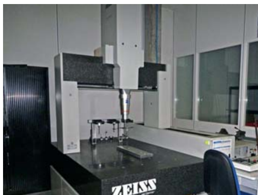
Tridimensionnelle ZEISS UC850