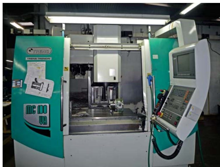
Centre d'usinage TRENS TRENCIN NC 100 VA