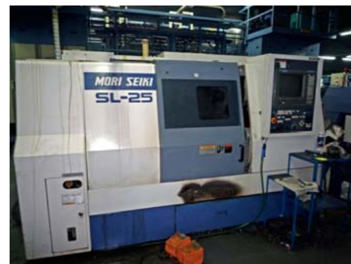
Tour à commande numérique MORI SEIKI SL 25