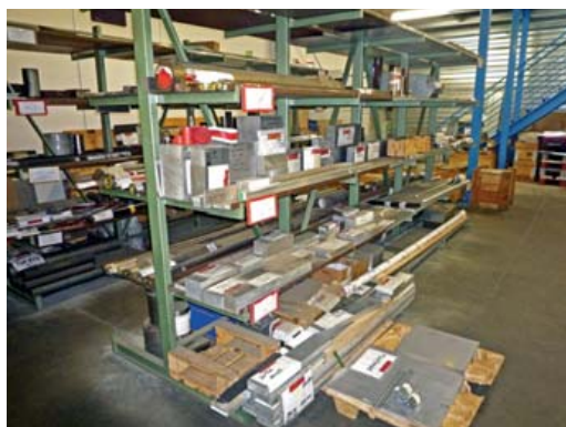
Stock de matières