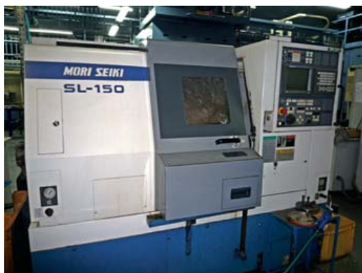
Tour à commande numérique .MORI SEIKI SL150