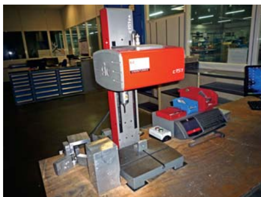
Machine à graver SIC MARKING C151