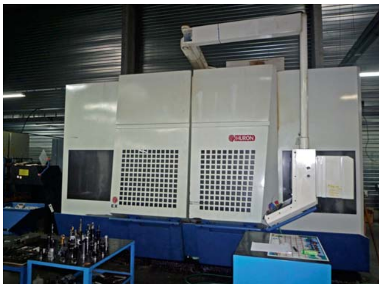
Centre d'usinage HURON EX 10

SMZ 800, machine à graver laser SIC MARKING C151, petit matériel de contrôle, banc de préréglage ZOLLER SMILE 600, banc de frettage SECO EPB Easy Shrink 20, banc de préréglage ZOLLER 650 Z