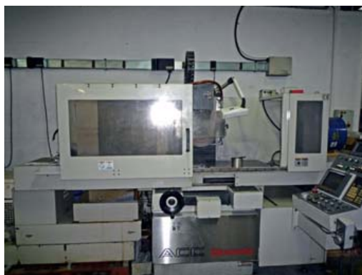
Rectifieuse plane OKAMOTO ACC 63EX