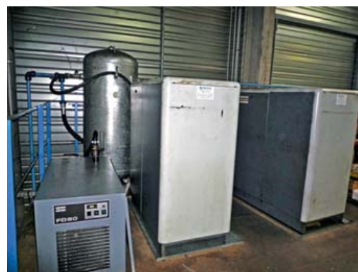
Compresseur ATLAS COPCO