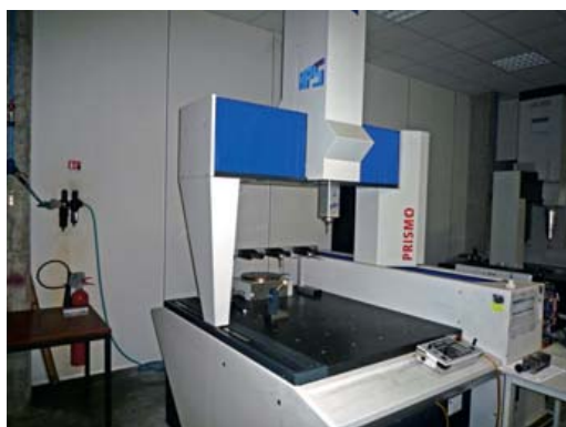
Tridimensionnel PRISMO ZEISS