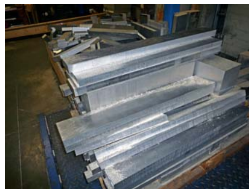
Stock de matières

Règlement comptant : en espèces jusqu'à 1 000 € frais inclus, carte bancaire, virement (aucun chèque simple ne sera accepté)