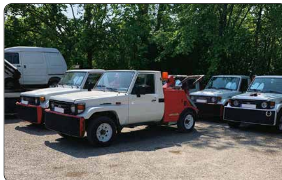
Dépanneuses TOYOTA Land Cruiser

Règlement au comptant sous 48 h en espèces dans la limite disponible, CB, chèque de banque ou lettre accreditée, virement bancaire