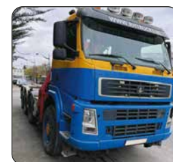
VOLVO 68 Ampliroll, 2009