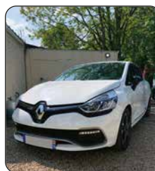
RENAULT Clio Sport RS Trophy, 2016