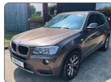
BMW X3, 2012