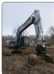
Pelle HITACHI, 2008