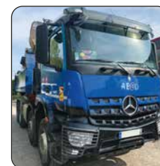
MERCEDES Actros, 2018