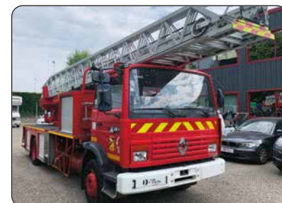
RENAULT M210 Midliner, échelle EPSA 32 CAMIVA