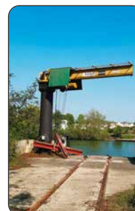
Potence KONE, 1992