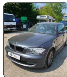
BMW 116 D, 2008