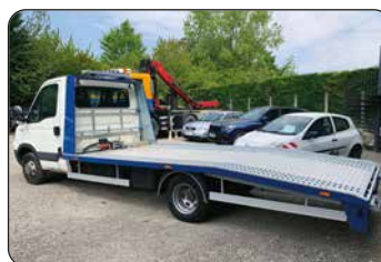
IVECO porte voiture 35C13, 2011